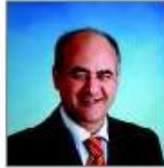
Miguel Ángel García Nieto Alcalde de Ávila